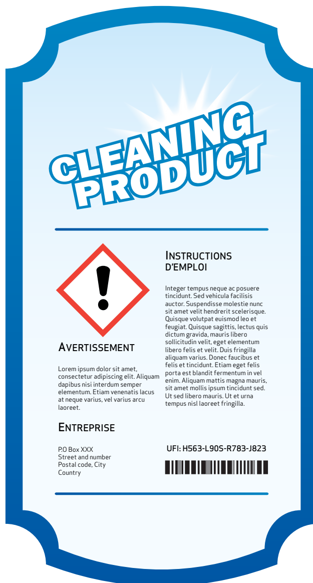
Exemple d'étiquette de produit intégrant clairement le code UFI du produit.

Si vous disposez de mélanges existants déjà identifiés au niveau national, conformément aux règles en vigueur dans l'État membre concerné, vous pouvez bénéficier d'une période transitoire qui s'achève le 1 er janvier 2025. Toutefois, si vous modifiez ces